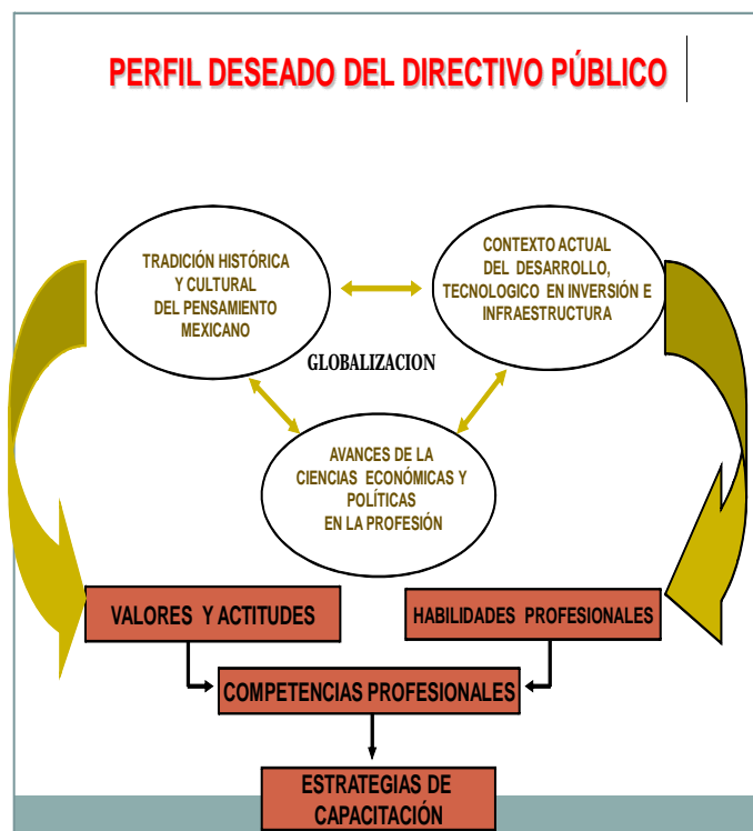
Figura 3 Perfil deseado del directivo público

Este concepto fundamenta el sistema, y se identifica con que “hacerlo bien” en el puesto de trabajo no solamente está asociado a los conocimientos y habilidades que se posean, sino “...que está ligado a las características y cualidades propias de los directivos públicos, a su competencia” 7 . En la práctica de la dirección, donde se establecen relaciones permanentes y directas con diversas personas en disímiles situaciones, la