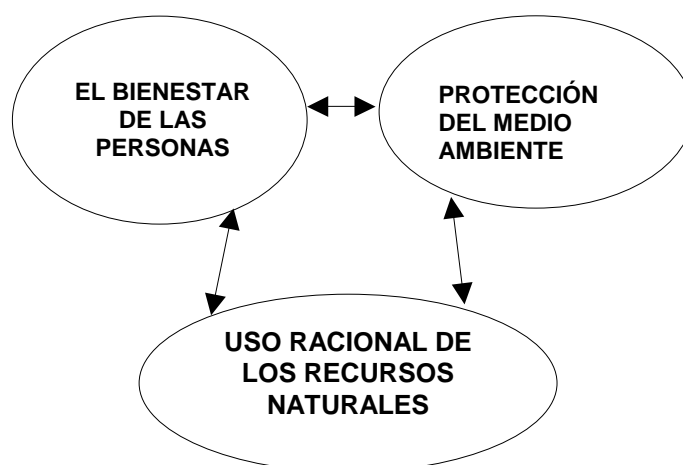
Figura 1. Concepción del Modelo Teórico

La propuesta teórico metodológica para la Planeación del Desarrollo Regional en la Política de Inversión en Infraestructura, parte, tal como lo plantea el Programa de Naciones Unidad para el Desarrollo PNUD en el 2012 de la armonización de tres variables fundamentales 1 :