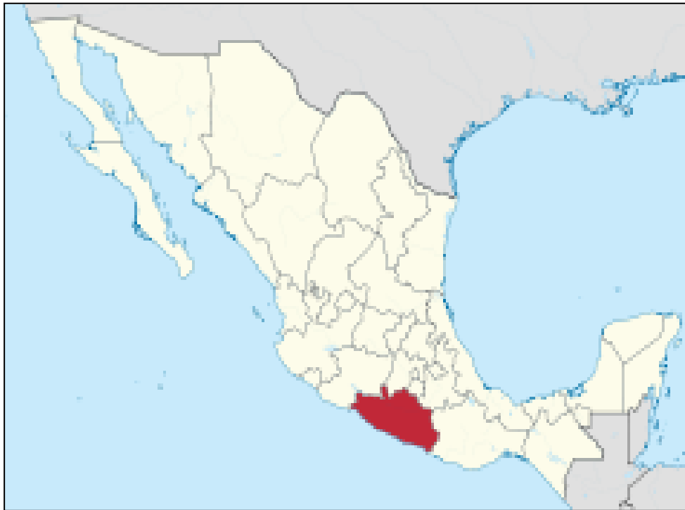
Mapa 1.- Estado de Guerrero. División Regional y Municipal