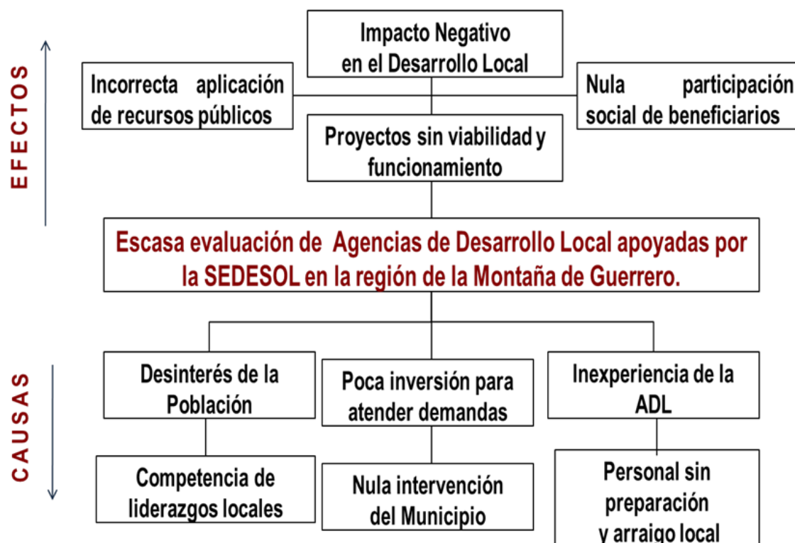
Cuadro 1.- Árbol de problemas

realizadas, el proceso, el costo beneficio y el impacto aportado al proceso del desarrollo regional y local en ambos municipios, que permita profundizar en la problemática general del desarrollo local que se promueve en la Montaña de Guerrero y más aún en el caso específico de estos dos municipios por la problemática que presenta, principalmente por ser considerados los más pobres y marginados del país.