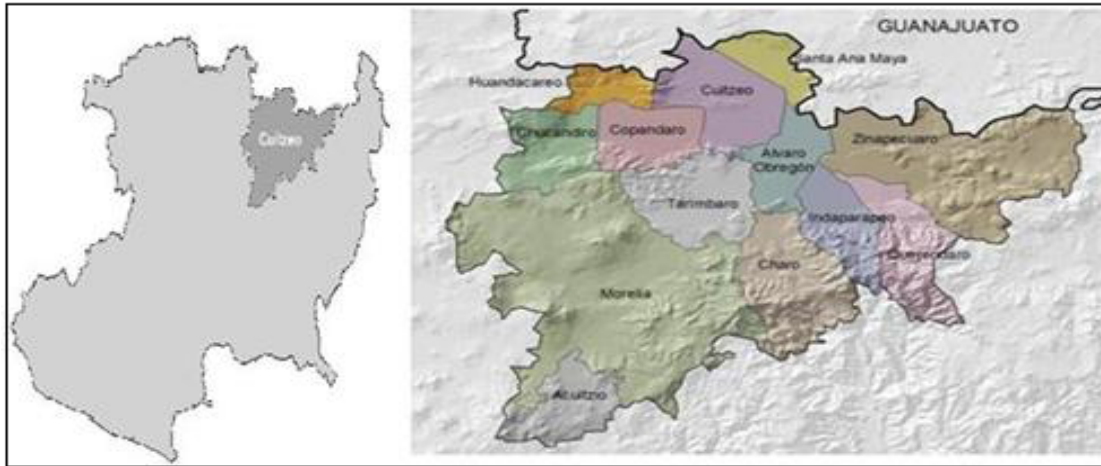
Mapa 2.- Ubicación Geográfica del Municipio de Cuitzeo, Michoacán