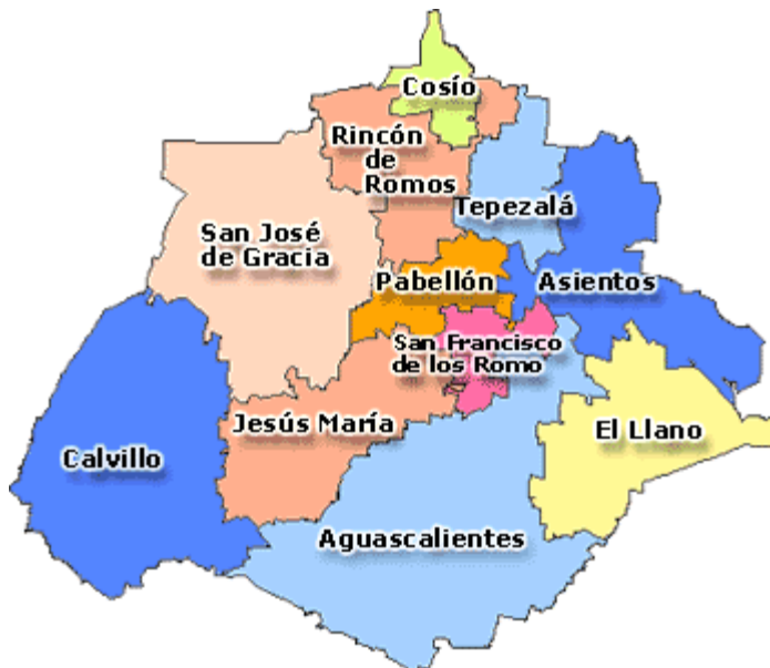
FIGURA 1 DIVISIÓN MUNICIPAL DEL ESTADO DE AGUASCALIENTES