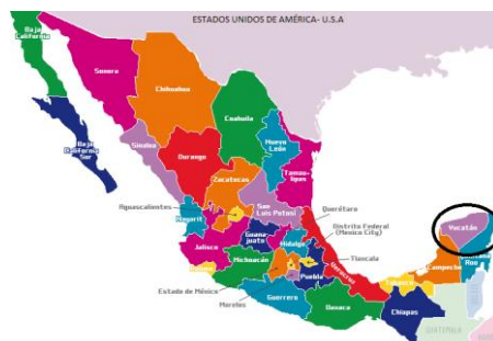
Figura 1. Ubicación del Estado de Yucatán en la República Mexicana