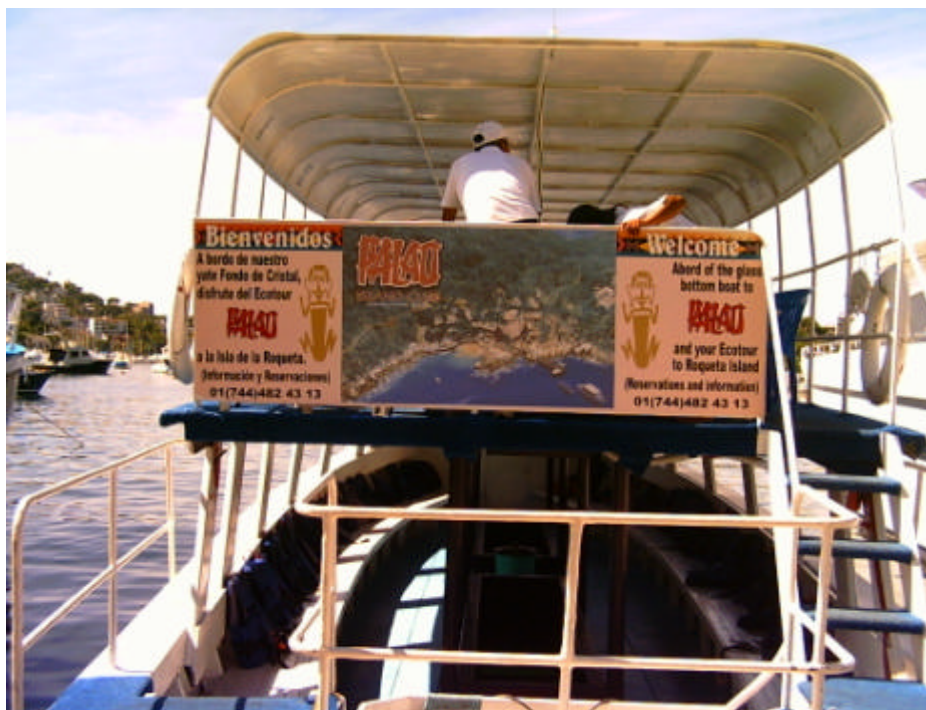
Figura 4. Paseo turístico-recreativo en La Roqueta.

El programa de actividades recreativas incluirá un subprograma de excursión que permita al visitante la práctica del campismo recreativo, que auspicie su contacto con la naturaleza y estreche vínculos familiares y sociales (figura 4).