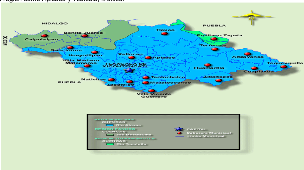
Figura 1.- Mapa de localización del municipio de Tlaxco y municipios que integran su área de estudio en la región como Apizaco y Tlaxcala, México.

Fuente. Cuenca Río Atoyac (18 A) y Río Zahuapan (18 AI). Este último río es la principal corriente de Tlaxcala. (México > Información Geográfica > Mapa con Regiones Hidrológicas)