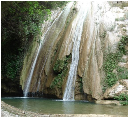
Figura 2. Cascada Río Grande

y el aprovechamiento se les puede dar a los diferentes recursos con los que cuenta el municipio de Santiago Huaucilla.