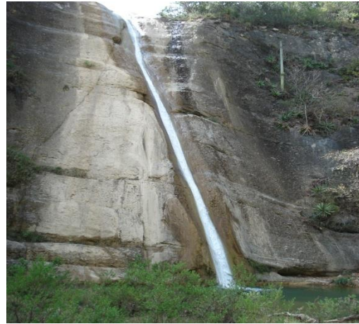
Figura 3. Cascada Río Verde