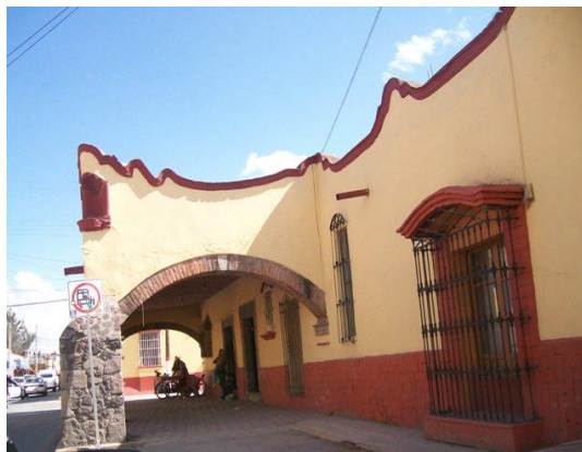
Fotografía 2. Casa de los Arcos en la calle Guadalupe Victoria en 2010.

El pico de Tenerife, es una casa particular utilizada en la actualidad como comercio, se encuentra ubicada en la plaza Benito Juárez, Esq. Miguel Hidalgo, la época de su construcción fue en el siglo XVIII, es característica de su época y es un punto de referencia muy común para los habitantes Teotihuacan (Véase fotografía 3).