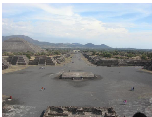
Fotografía 6. Zona Arqueológica de Teotihuacan en 2009.

El pueblo de Teotihuacan vive de las actividades turísticas. A pesar de concentrar un área de uso agrícola considerable, la actividad comercial y de servicios ha incrementado este tipo de uso de suelo. Así el comercio y los servicios turísticos son las actividades de mayor dinamismo en el municipio, sin embargo, Teotihuacan no acaba de integrar la riqueza prehispánica y la imagen del pueblo para formarse una imagen con elementos únicos que permitan formar un concepto integral de Teotihuacan. Cómo lo señala el Instituto Nacional de Antropología e Historia (INAH), la zona arqueológica es un patrimonio histórico, no un recurso turístico, motivo por el cual entidades como el INAH y el Ayuntamiento no podrán ponerse de acuerdo para definir estrategias de desarrollo de actividades turísticas. (Véase fotografía 5).