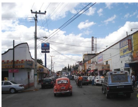
Fotografía 1. Parte del Centro Histórico de Teotihuacan en 2009

Un nodo de suma importancia es el centro histórico, pues es un punto estratégico de concentración, el problema fundamental que se observa es el congestionamiento vehicular (Véase fotografía 1), ya que existen base de taxis en sus límites y el área es muy pequeña sólo cuenta con 6,776m 2 de plaza. Se torna demasiado conflictivo al entrar y salir de esta área, ya que contiene demasiadas confluencias de sendas y problematiza la estancia de visitantes y lugareños, casi no se identifica como el centro del municipio por la imagen que proyecta, es pequeño, está recién remodelado, pero no genera una imagen agradable ni identitaria.