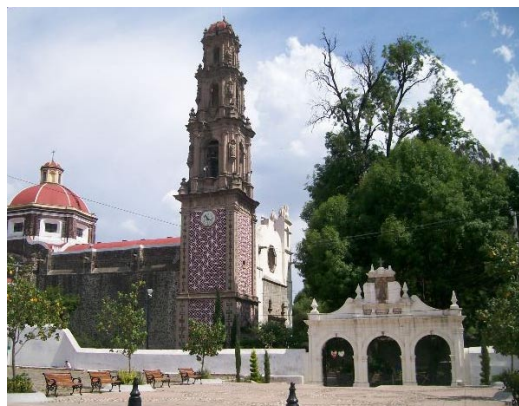
Fotografía 4. Estado actual de la parroquia de San Juan de Bautista. Inmueble histórico en 2010.

Respecto a la Parroquia de San Juan Bautista, es un ejemplo de la arquitectura del siglo XVI, aunque con modificaciones durante el siglo XVIII. Esta obra arquitectónica es un punto de referencia para los habitantes del municipio, es un edificio que representa el periodo histórico de la colonia, base fundamental para la construcción de la identidad nacional (Véase Fotografía 4).