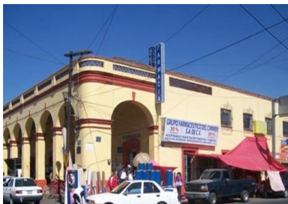
Fotografía 3. El pico del Tenerife en 2009.

El pico de Tenerife, es una casa particular utilizada en la actualidad como comercio, se encuentra ubicada en la plaza Benito Juárez, Esq. Miguel Hidalgo, la época de su construcción fue en el siglo XVIII, es característica de su época y es un punto de referencia muy común para los habitantes Teotihuacan (Véase fotografía 3).