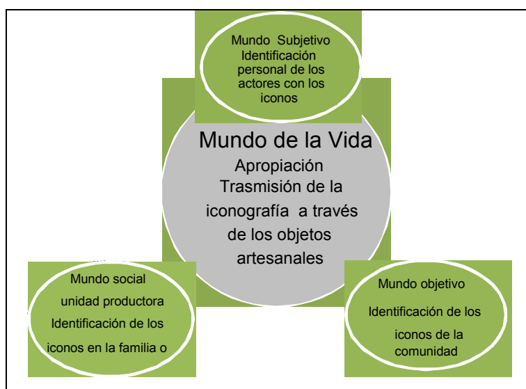
Esquema 3. Mundos de la vida y procesos de significación