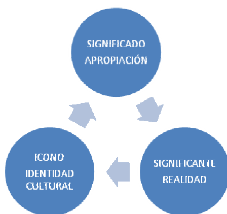
Esquema 1. Triada de Relación del icono como identidad cultural.