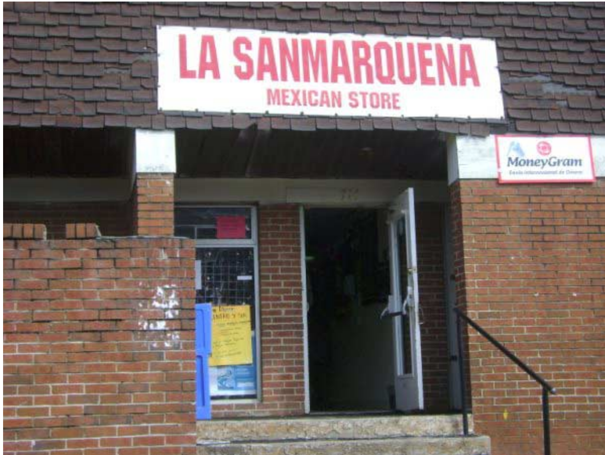
Foto 1. Tienda de empresario guerrerense en Atlanta, Georgia