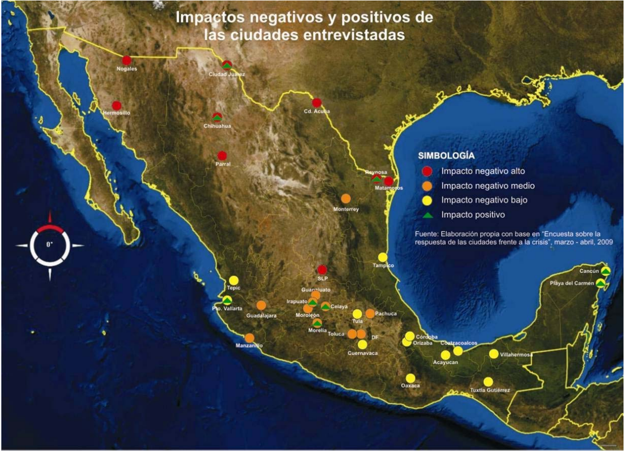
Mapa 1. Impactos negativos y positivos de la crisis en las ciudades entrevistadas

promoviendo la diversificación de contratos y productos industriales para distintos sectores (Ciudad Juárez y Chihuahua); se están aprovechando los ajustes de la paridad cambiaria que, por un lado, promueve la instalación de empresas maquiladoras estadounidenses en ciudades de la frontera norte (Ciudad Juárez y Reynosa), y por otro, ha permitido dar continuidad a los servicios turísticos de altura internacional (Cancún, Playa del Carmen, Puerto Vallarta y Morelia); también se observa el crecimiento de la industria agro-alimentaria (Irapuato); finalmente, en algunas ciudades se están promoviendo inversiones en infraestructura para el futuro (Tula - Nueva Refinería, Manzanillo – ampliación de capacidades portuarias, Matamoros – puente ferroviario).