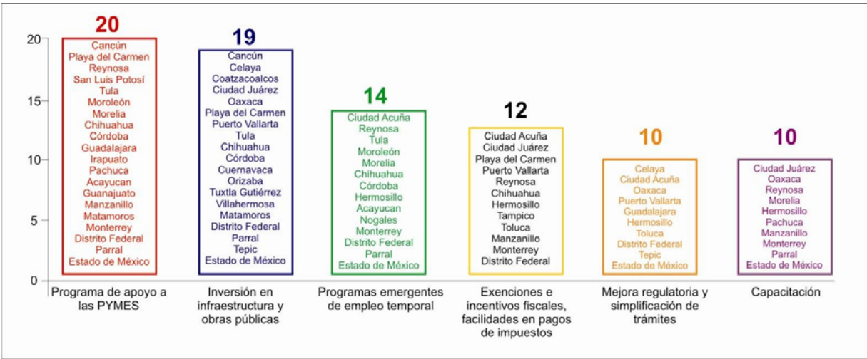
Gráfica 2. Principales acciones emprendidas desde el ámbito local