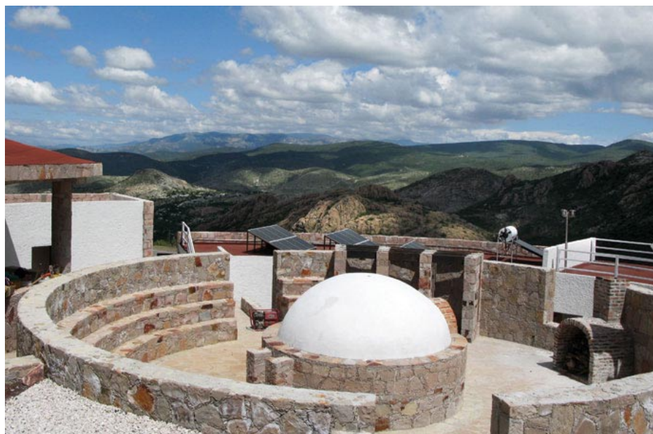
Centro Ecoturístico la Tortuga

La marginación de un pueblo, las creencias diversas de otros, las que parecieran verdades en una comunidad donde un pueblo otomí - chichimeca escribe su propia historia, algo diferente donde el turismo rural - ecológico y el turismo de salud surge, es complementado por las ecotecnias, en la búsqueda de un destino sustentable y lleno de magia, es así que el centro Ecoturístico la Tortuga, surge a unos pasos del tercer monolito más grande del mundo, la Peña Bernal en el municipio indígena de Tolimán en Querétaro, México.