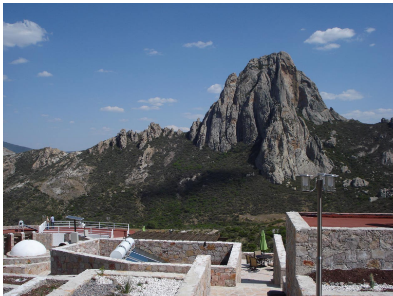
Peña de Bernal, vista desde el centro Ecoturístico la Tortuga

De acuerdo con estadísticas y Mapas de la Comisión Nacional para el Desarrollo de Pueblos Indígenas (CDI), el 60 % de la población indígena aproximadamente 6.02 millones de personas viven en municipios indígenas, representando la población indígena más del 40% del total municipal.