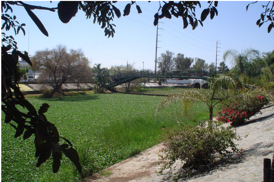
Foto 1. Río Zula y su encuentro con el río Santiago en Ocotlán

Fuente: Biblioteca Pública del Estado de Jalisco. Mapa 31. Mapoteca. 1983.