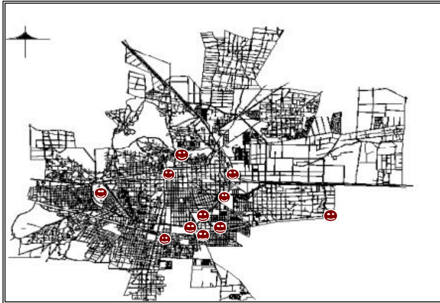
MAPA 2 PRINCIPALES LUGARES DE LA CIUDAD DE TOLUCA, DONDE SE LOCALIZAN MENORES REALIZANDO ALGUNA ACTIVIDAD, 2003