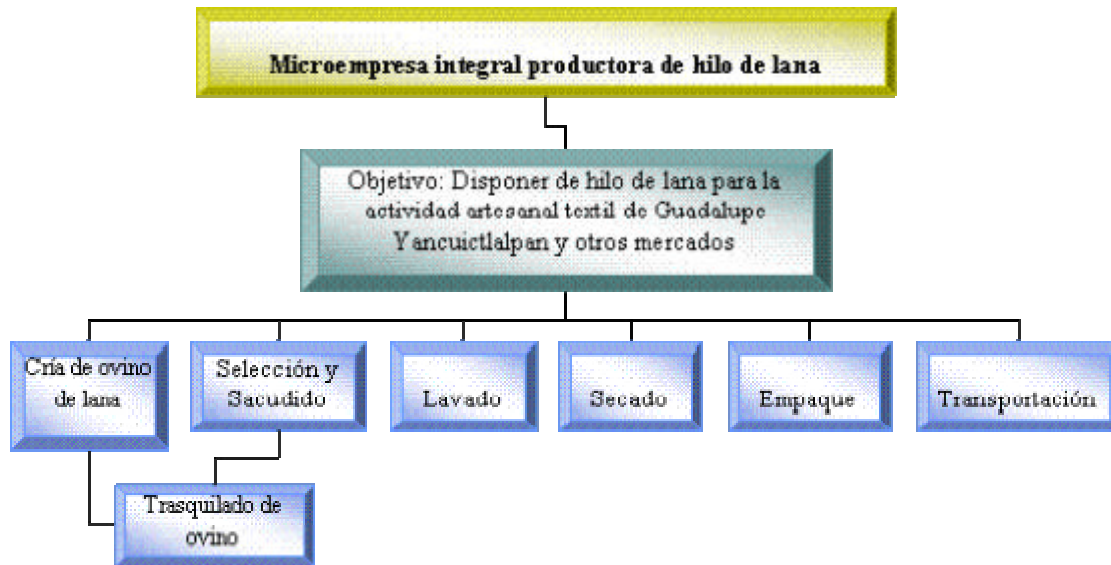
Esquema 1: Proceso de Producción de la Microempresa de Hilo de Lana