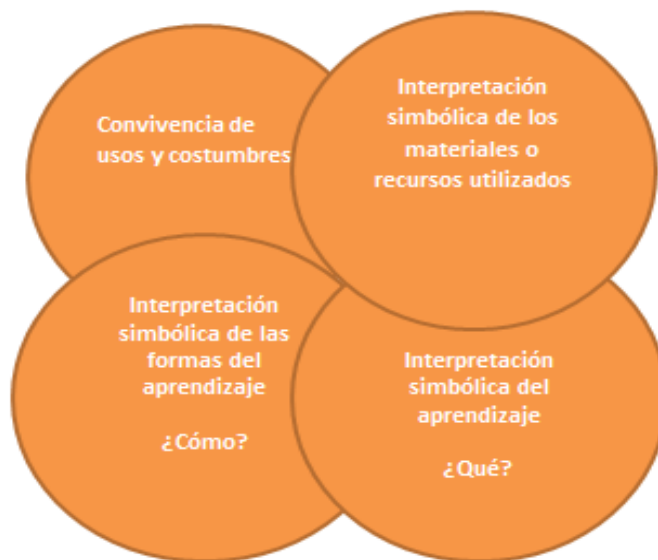
Figura 1. Perspectiva sociocultural del aprendizaje en las comunidades