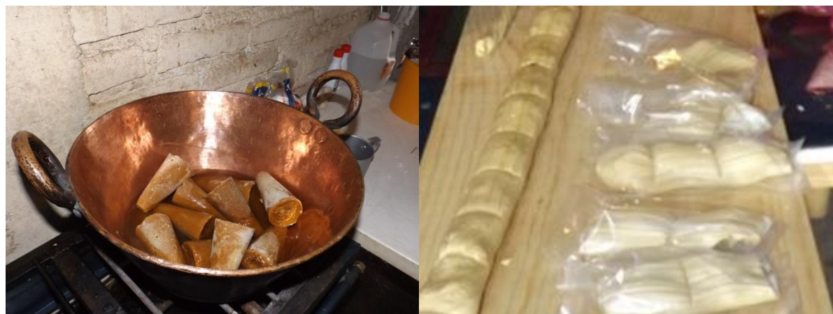
Figura 1. El piloncillo y las charamuscas

Guanajuato. La base de su elaboración es el piloncillo o panocha (dulce de caña de azúcar) y se rellena, principalmente de queso, nuez, pasas, o cacahuete. Es un producto alimenticio de origen natural y lleno de tradición en la comunidad.