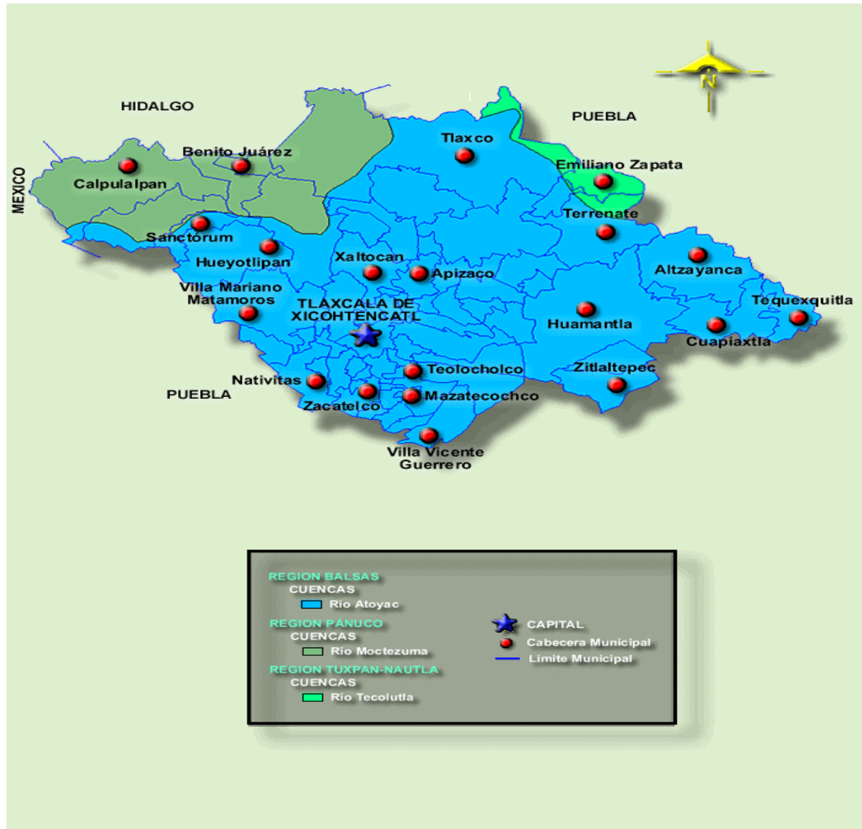
Figura No. 1.- Mapa de localización de municipios que integran el Área de Estudio de la Cuenca del Río Zahuapan, en Tlaxcala, México.

Cuenca Río Atoyac (18 A) El río Atoyac, que da origen al Balsas, dentro del estado de Tlaxcala, se forma a partir de los escurrimientos que bajan por la vertiente norte del Iztaccíhuatl desde una altitud de 4,000 msnm, en los límites de los estados de México y Puebla. La corriente toma el nombre de Atoyac desde que se une con los ríos Tlahuapan y Turín. Sus afluentes intermedios son el río Atoyac-San Martín Texmelucan (18 AD), el lago Totolzingo (18 AH) y el