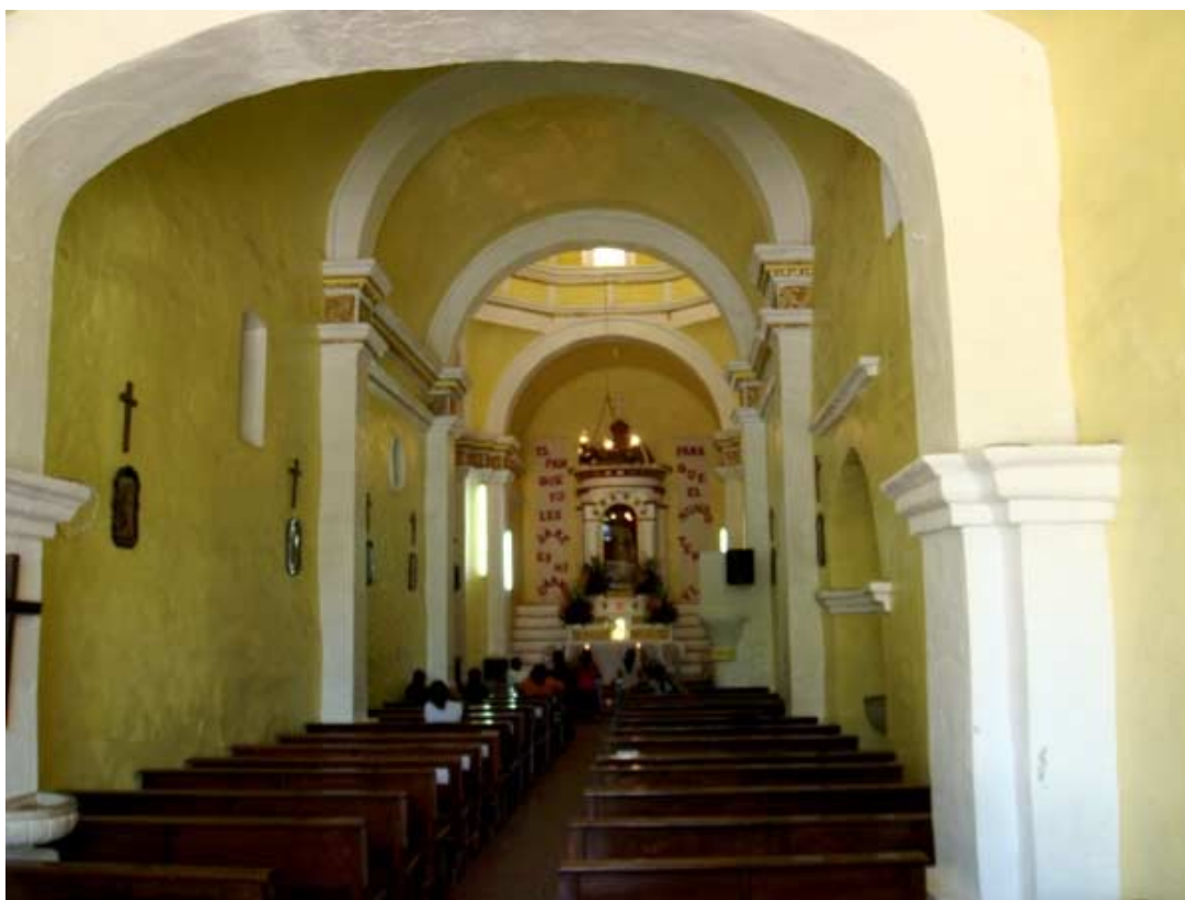
Interior de la Iglesia de San Mateo