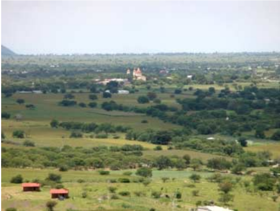
El Valle de Amatzinac, asiento de Chalcatzingo

chachalaca, urraca, zopilote, lechuza) de la zona, así como adentrarse a la comunidad de Jantetelco, pudiendo así deleitarse de otros aspectos, además de los antes mencionados, como la ocasión de consumir los productos y la gastronomía local.