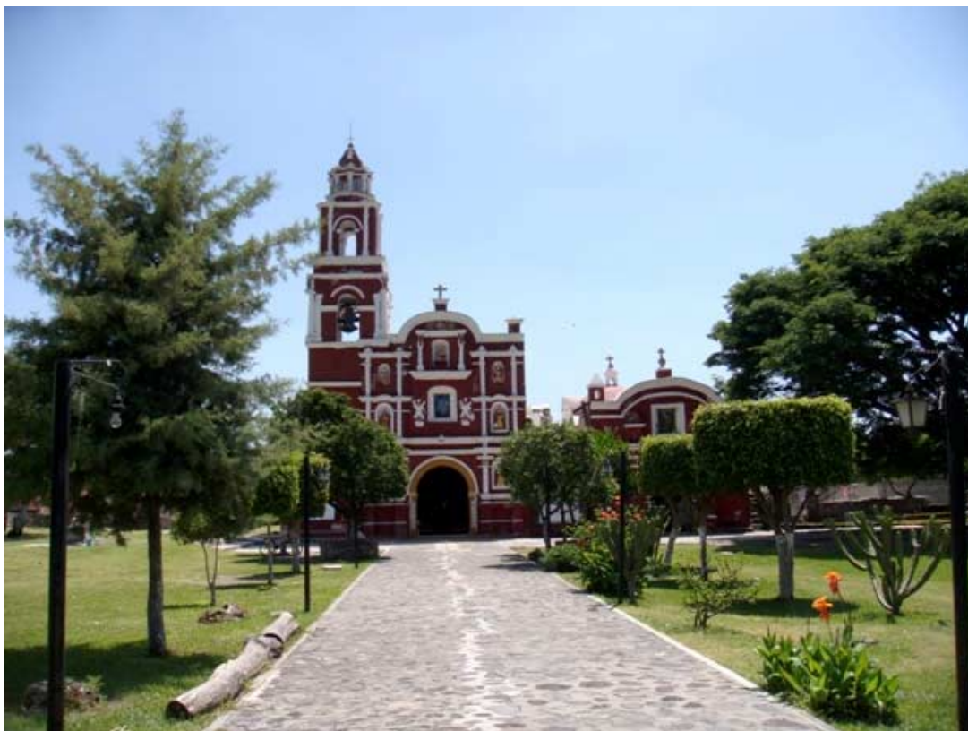
Iglesia de San Mateo del siglo XVIII en el pueblo de Chalcatzingo