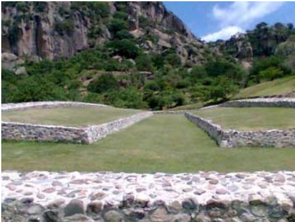
Juego de pelota

Otras fuentes de información se han encontrado en códices, relatos de cronistas y viajeros, así como las creencias de grupos temporalmente paralelos o geográficamente relacionados. En cualquier caso, una visita a Chalcatzingo ofrece al visitante un viaje en el tiempo al período formativo de una de las culturas prehispánicas más importantes de Mesoamérica y cuya influencia aun hace eco en las comunidades aledañas.