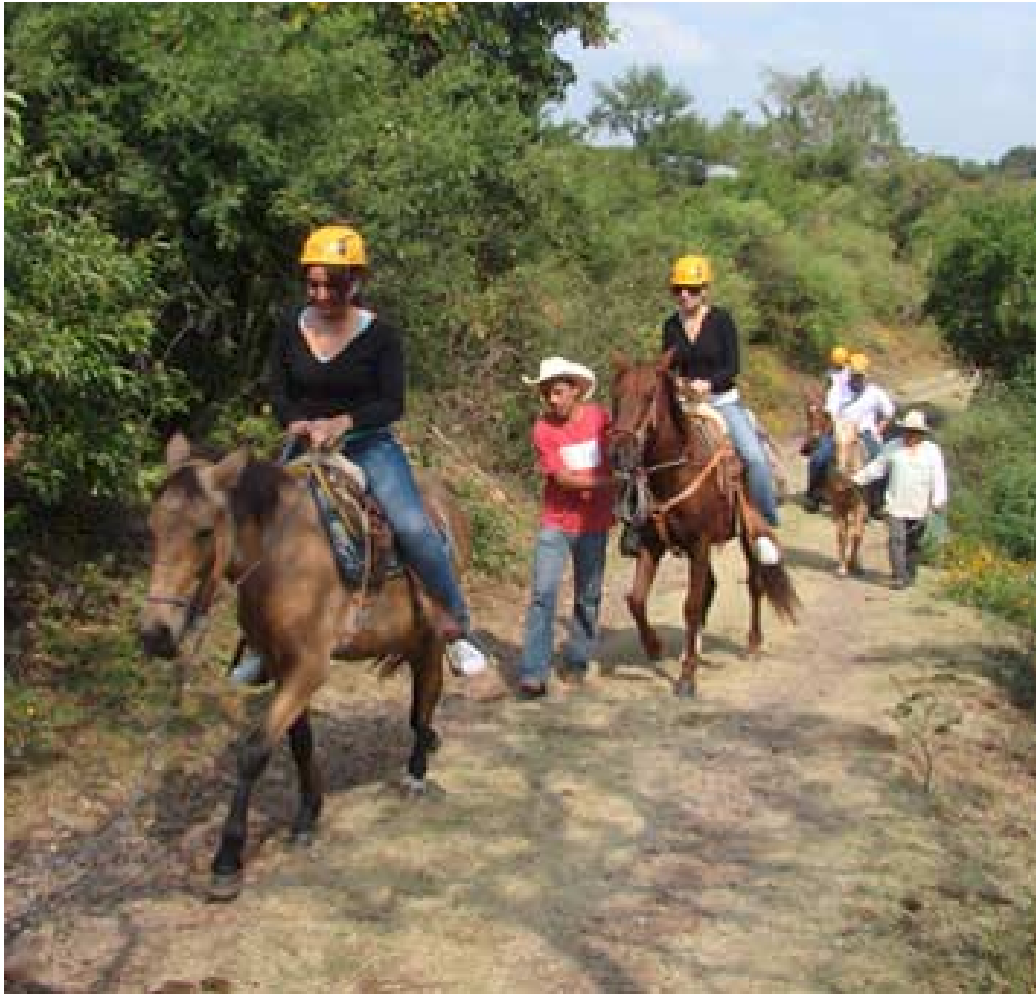
Recorrido a caballo dentro del Cerro El Chumil

Otro lugar que vale la pena visitar es Centro ecoturístico del Cerro El Chumil, también conocido como el cerro “cabeza de mono”, el cual ofrece recorridos a través de terrenos comunales, cuyo atractivo radica en un entorno de selva baja caducifolia, disfrutando de recorridos y vistas panorámicas extraordinarias, en contacto con la naturaleza en un ambiente rural.