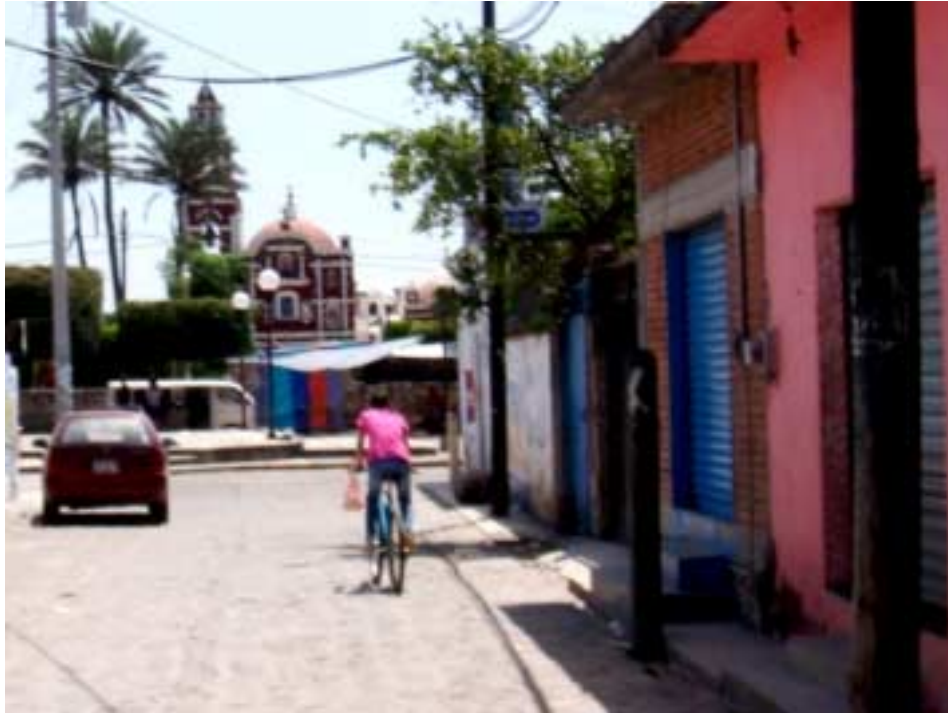
Entrada al pueblo de Chalcatzingo

Y hay más historia del Municipio de Jantetelco que la de sus dulces, ya que aquí nació y vivió el cura Don Mariano Matamoros, quien junto al Generalísimo Don José María Morelos y Pavón, se unió al movimiento de Independencia en diciembre de 1811. Actualmente, “El Dormitorio” del cura Mariano Matamoros, declarado desde 1875 como monumento histórico, alberga al museo Histórico y a los restos de Don Mariano Matamoros.