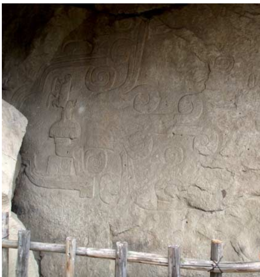
Petroglifo "El Rey", esculpido en la roca de la montaña.

Los grupos prehispánicos que habitaron Chalcatzingo contaban con creencias y prácticas funerarias aun no del todo comprendidas. Algunos elementos de los rituales funerarios pueden ser rescatados de la información que ha provisto la investigación arqueológica y el análisis de los antropólogos físicos.