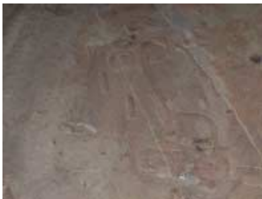
Petroglifo "El portador de agua"