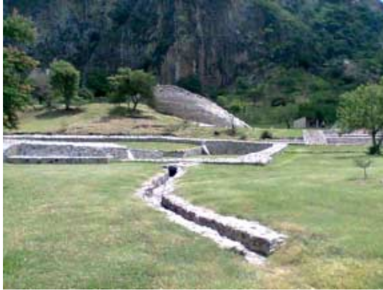
Vista panorámica del centro ceremonial de Chalcatzingo

Otras fuentes de información se han encontrado en códices, relatos de cronistas y viajeros, así como las creencias de grupos temporalmente paralelos o geográficamente relacionados. En cualquier caso, una visita a Chalcatzingo ofrece al visitante un viaje en el tiempo al período formativo de una de las culturas prehispánicas más importantes de Mesoamérica y cuya influencia aun hace eco en las comunidades aledañas.