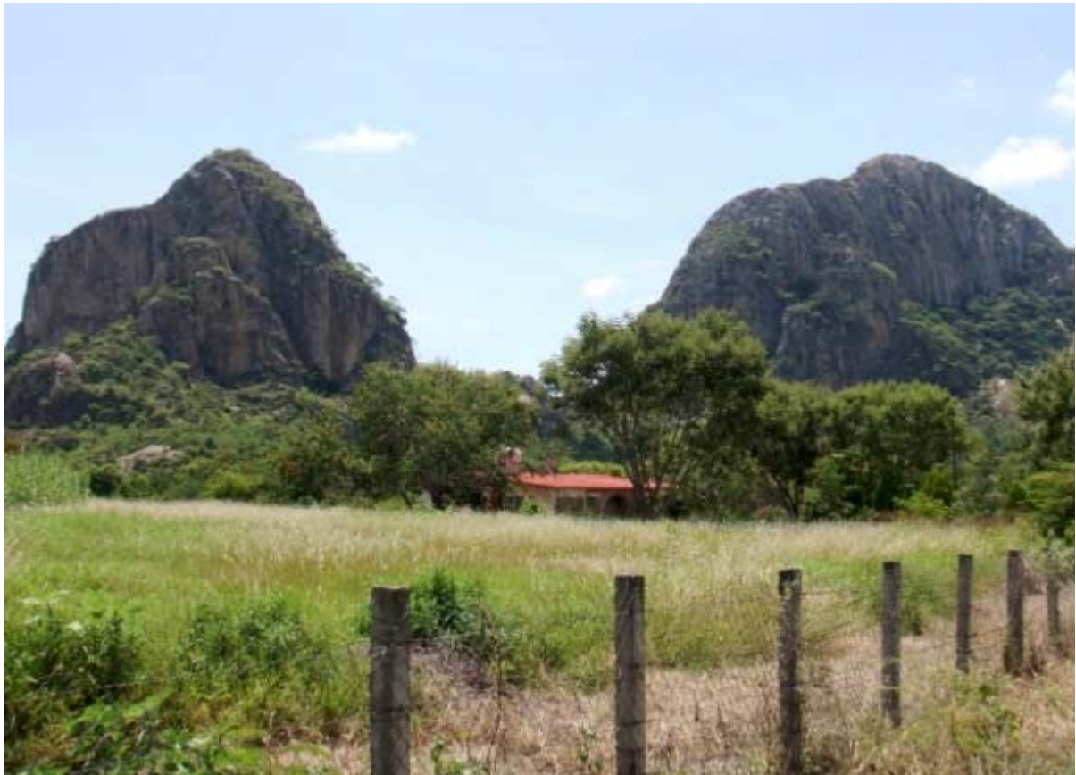
Cerro Delgado (izquierda) y cerro Chalcatzingo o de la Cantera, forman una V, en cuyo centro está la plaza principal

construido al pie del cerro de Chalcatzingo y el Cerro Delgado. El primero de ellos tiene evidencia de haber sido un espacio ritual de primera importancia para los antiguos habitantes de la región.