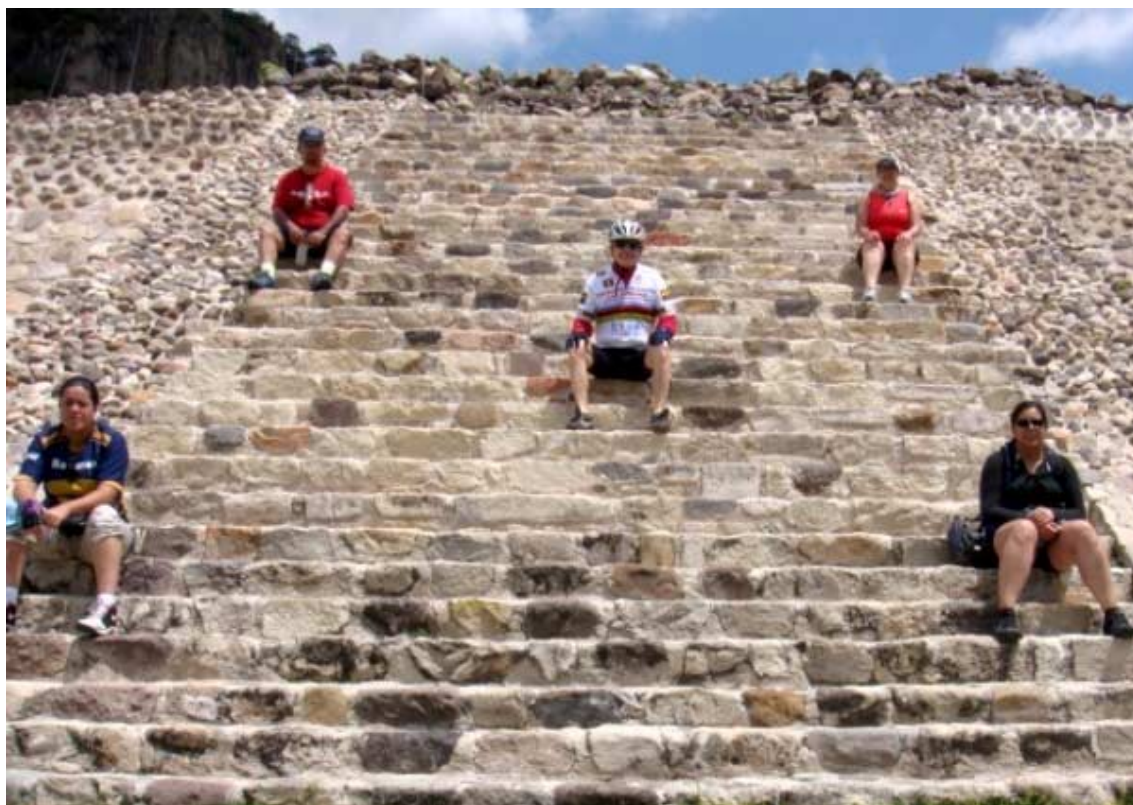
Grupo de turistas en la pirámide de Chalcatzingo