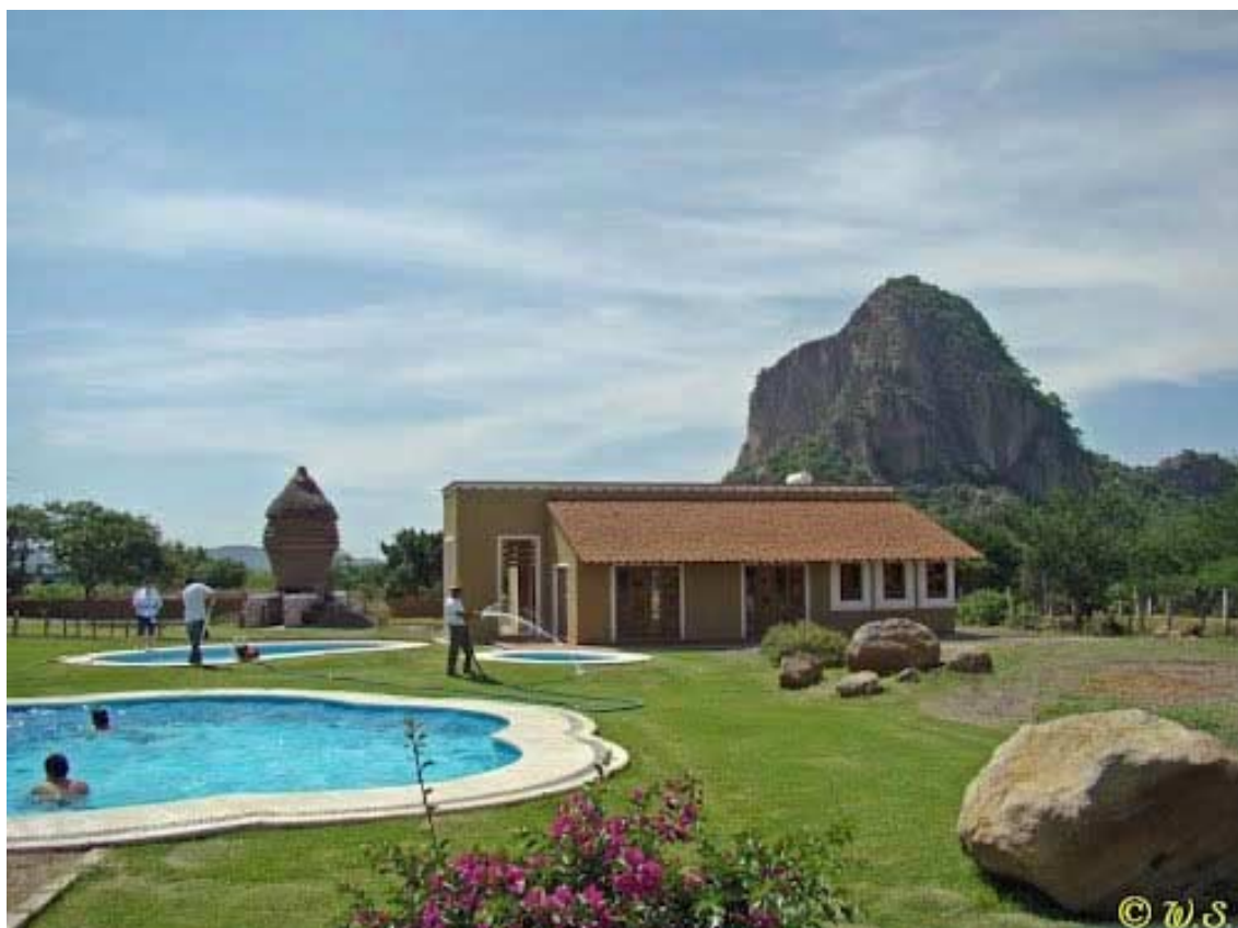
Centro ecoturístico Piedra Rajada, en las faldas del Cerro de Chalcatzingo