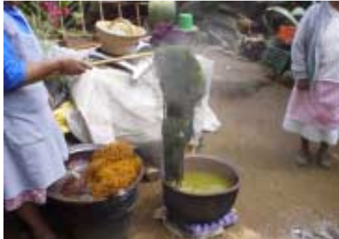
Ilustración 1. Preparación de tintes naturales

Como parte de las innovaciones al proceso, las artesanas que elaboran el teñido natural, lo hacen en grupos, con el propósito de eficientar el proceso y minimizar costos en la obtención de la materia prima. Cuando se pigmenta con tintes naturales, se recurre a coleccionar sustancias que pueden ser de origen vegetal o animal, estas se extraen macerando o hirviendo la parte de la planta o animal, que tiñe (Ilustración 1).